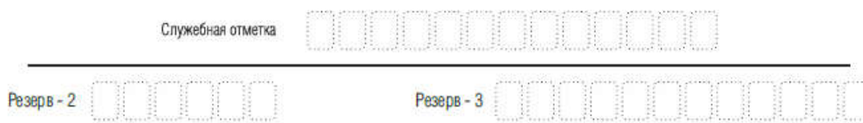
Рис. 5. Поля для служебного использования

Поля для служебного использования «Служебная отметка», «Резерв-2» и «Резерв-3» не заполняются.