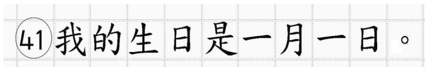
Рис.14. Образец написания иероглифических знаков

Односторонний бланк ответов № 2 (лист 1 и лист 2) предназначен для записи ответов на задания с развернутым ответом по китайскому языку (строго в соответствии с требованиями инструкции к КИМ и к отдельным заданиям КИМ). Каждый иероглифический знак и каждый знак препинания следует писать внутри отдельной клетки области ответов бланка ответов №2 (дополнительного бланка ответов №2) (рис. 14).