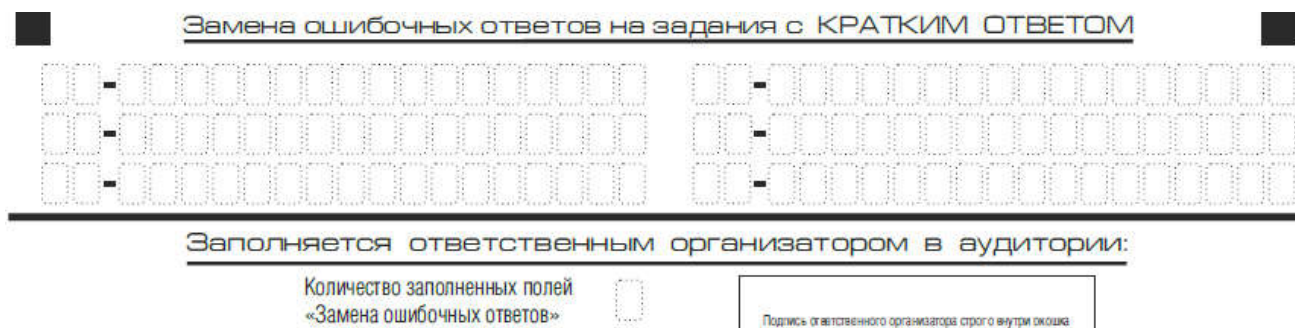
Рис. 9. Область замены ошибочных ответов на задания с кратким ответом

Запрещается записывать ответ в виде математического выражения или формулы. В ответе не указываются названия единиц измерения (градусы, проценты, метры, тонны и т.д.) – так как они не будут учитываться при оценивании. Недопустимы заголовки или комментарии к ответу.