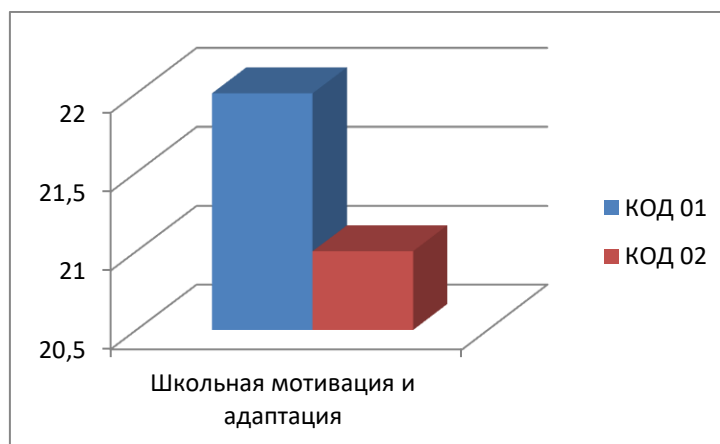
Рисунок 1. Результаты по исследованию школьной мотивации учащихся 2 класса

2. Результаты по исследованию эмоционального климата в классе «Фейс-тест»